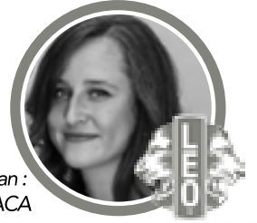
Hazırlayan : Ebru KARACA

Yıllar sonra bir erkek için ağladım... ama değdi adam gibi adamdı.