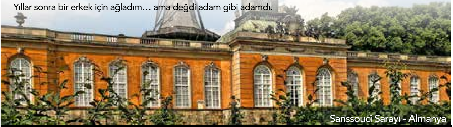
Sanssouci Sarayı - Almanya